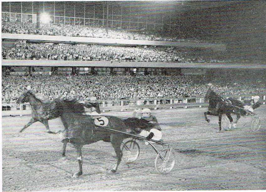
Oplobsbilledet fra »the big international«. Jamin klarer sig først i mål med Tornese ude i banen og længere tilbage Icare IV, der blev fjerde. Trediehesten, amerikanske Trader Horn, er ikke kommet med. — Bemærk tribunerne.

Den landede på La Guardia lufthavnen, og derfra sendtes en helikopter videre med lasten direkte til staldterrænet på Roosevelt.